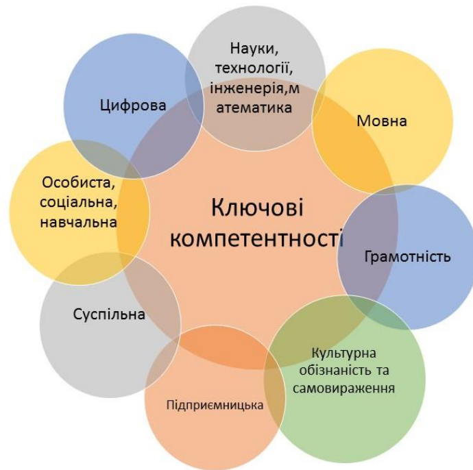
Рис. 1.1. Ключові компетентності учня ЗПТО.

Критерії оцінювання якості професійної освіти надзвичайно важливі для успішного освітнього процесу. Стан реалізації даних критеріїв оцінювання в закладах професійної освіти України наведено в додатку Б.