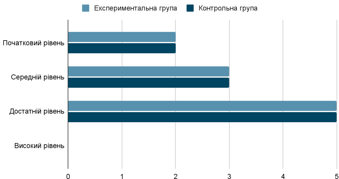
Рис.3.2.1. Порівняння рівнів сформованості ГК в контрольній та експериментальній групах до застосування вправ

Варто зазначити, що після впровадження системи вправ в експериментальній групі ситуація змінилася в кращу сторону. Це представлено в таблиці 3.3 (див. додаток Д, додаток Є). Проте в контрольній групі оцінки та рівні не змінилися.