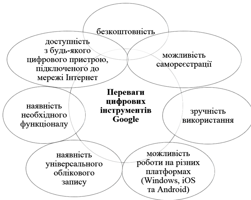
Рис. 1. Переваги цифрових інструментів Google