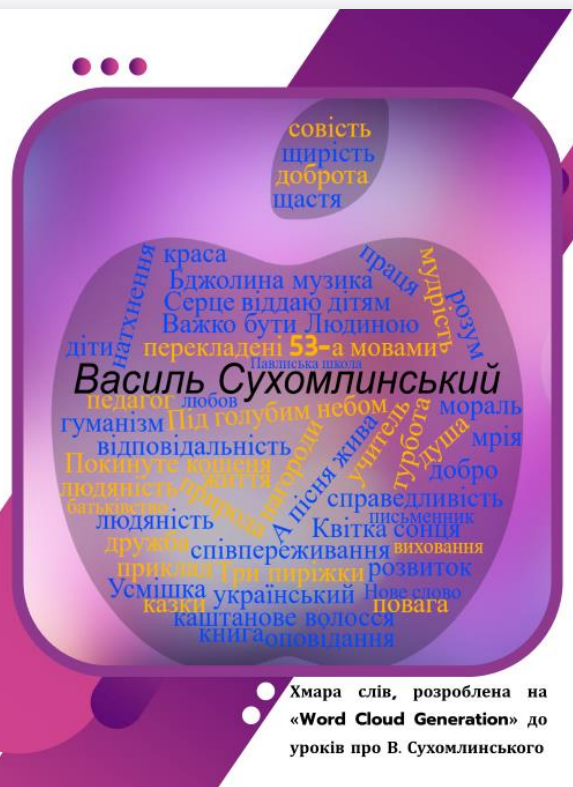
● Хмара слів, розроблена на «Word Cloud Generation» до уроків про В. Сухомлинського

Також у підручниках часто розміщені QR -коди і гіперпосилання, наприклад, за якими школярі мають змогу відвідати музей книги, здійснивши віртуальну екскурсію, ознайомитися із сайтами, на яких представлені різножанрові літературні твори.