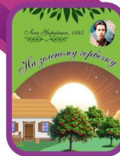
Обкладинка до улюбленого вірша