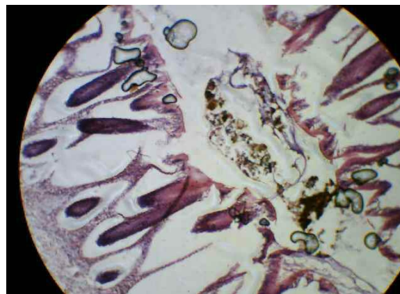
Рис. 2. Желчные конкременты и образования карбоната кальция в просвете кишечника карпа под влиянием глифосата (14 суток, ×40, гематоксилин-эозин)

Дальнейшие исследования были посвящены биохимическому обоснованию гистологических изменений печени карпа под влиянием глифосата. Полученные в нашем эксперименте результаты были обобщены в виде схемы (рис. 3), в которой учтена продолжительность эксперимента (7 суток, 14 суток) и концентрация глифосата – 0,04 мг/дм 3 и 0,08 мг/дм 3 (2 и 4 ПДК).