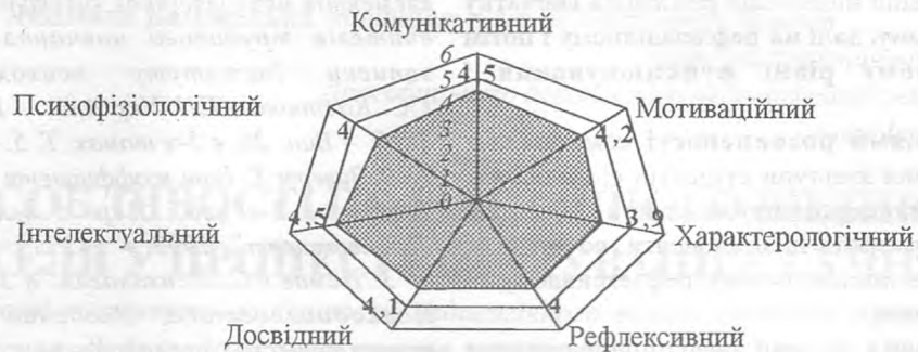
Рис. 1. Індивідуальний профіль розвиненості компонентів психологічної культури (досліджуваний Олександр В., студент другого курсу)