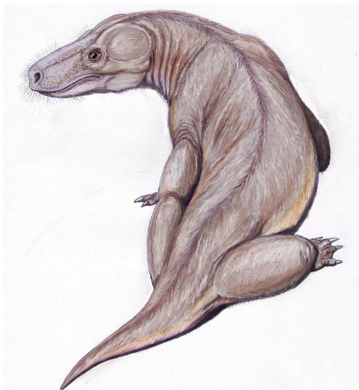
Рис. 1. Annatherapsidus petri

причинам было в 1961 заменено на Аннатерапсид петри (терапсид Анны Петровны). Видимо, так действительно лучше.