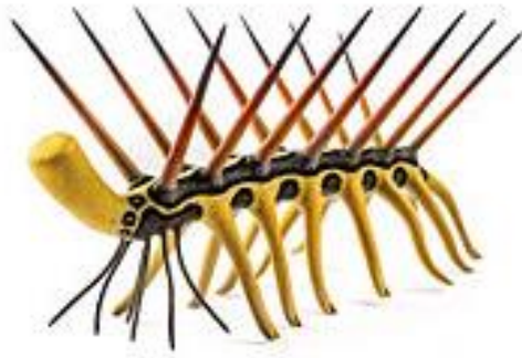
Рис. 3. Галлюцигения (вариант 2).

Еще один случай – название «ирритатор» («раздражитель»), отразившее состояние души палеонтологов, вынужденных работать с черепом динозавра, сильно попорченным любителями.