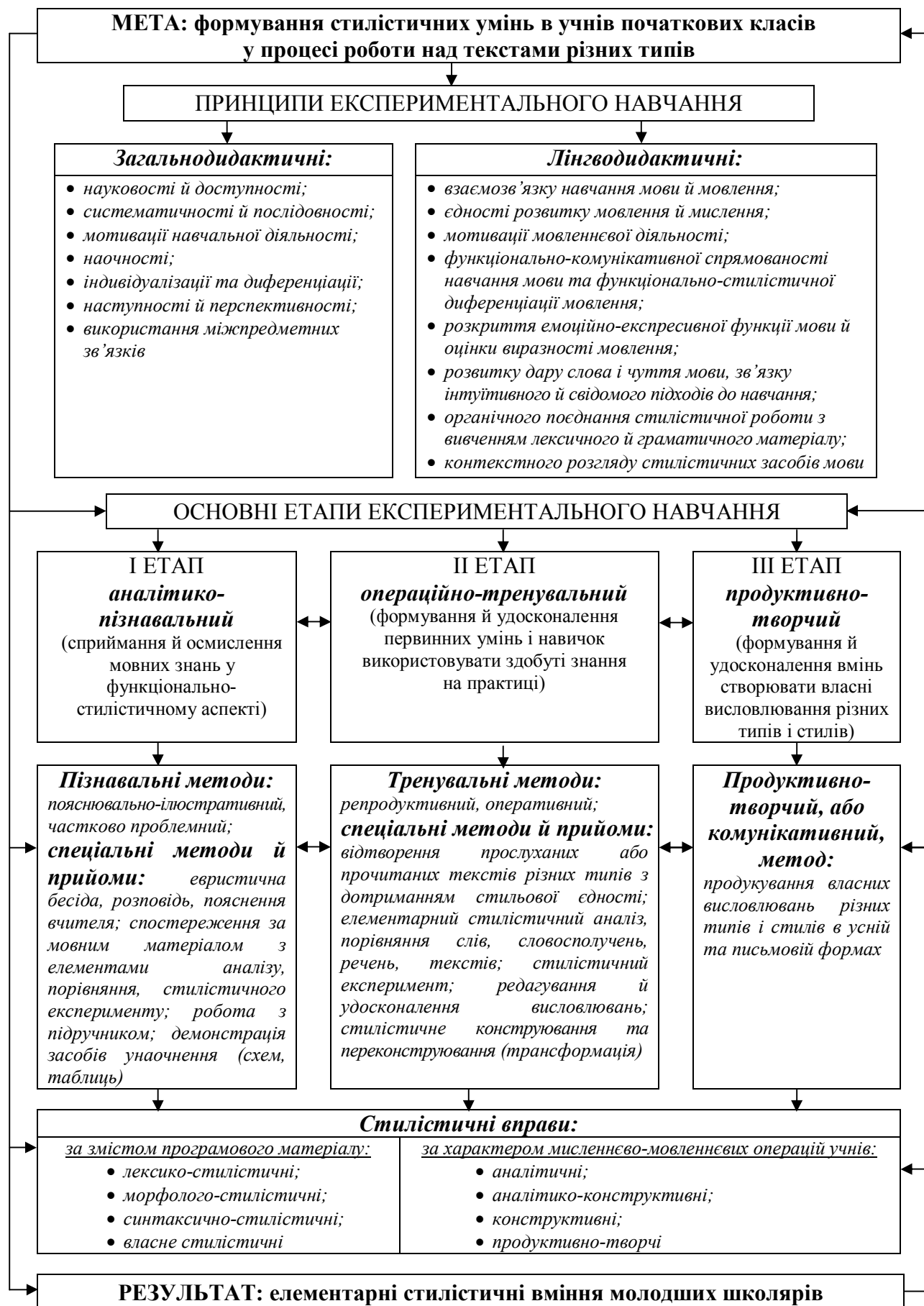
Рис. 1. Лінгводидактична модель формування стилістичних умінь молодших школярів у процесі роботи над текстами різних типів