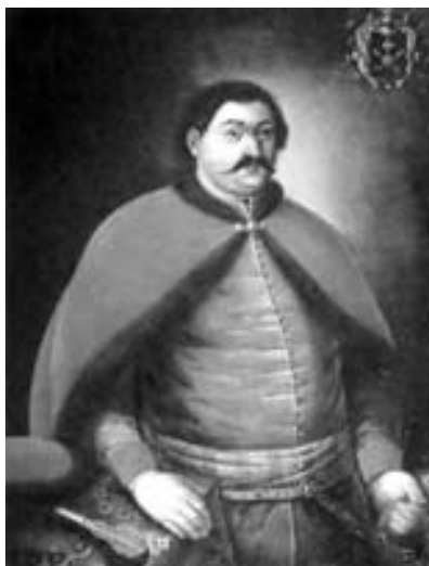
Портрет П. Полуботка. Копія ХІХ ст.

використанням килимових виробів у побуті людей різних станів. Більше відомо про побутування їх у житті козацької старшини, вони стали своєрідним феноменом елітарної культури українського суспільства того часу. Килими активно і широко використовувались у побуті та різних обрядах. Ними покривали столи, лави, ліжка. Рідше килими клали на підлогу – під час урочистостей і обрядових дійств. Навіть на початку ХХ ст. у поліських селах брали шлюб, стоячи на килимі. Інший килим лежав на ослоні, на якому сиділи батьки молодих. Під час поховального обряду тіло покійника вкривали килимом, який у цьому випадку мав символічне значення. Він поєднував світ живих і потойбічний світ мертвих [9, с.143 – 144]. Килими висіли на стінах осель, ними покривали засоби пересування – вози і сани. Саме функціональне призначення впливало на їхню форму, розміри, матеріали і техніки виконання, а подекуди і на елементи декоративного оздоблення. Наприклад, для ослонів робили вузькі і довгі килими переважно з геометричними візерунками. Для столів виробляли килими, формат яких наближався до квадрата і які мали більшу м'якість. На килимах для поховання зображали надгробки, урни у лаврових вінках, вміщували тексти із Святого письма [5, с.17].