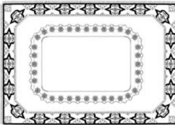
Спроба реконструкції килима з портрета В. А. Дуніна-Борковського. Комп'ютерна графіка О. Потапенко.

Розвиток килимарства в Україні зазначеного періоду був зумовлений широким