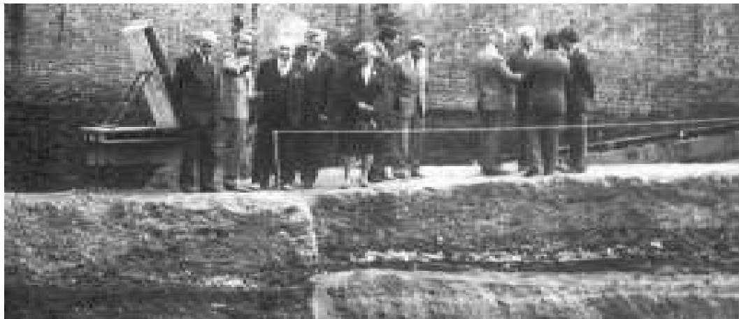
Рис. 1. Керівний склад V Міжнародного конгресу славістів під час огляду розкопів на чернігівському дитинці (жовтень 1985 р.)..

24. Медвищева А.А. Надпись на чаше из Чернигова (клад 1985 г.) // Архітектурні та археологічні старожитності Чернігівщини. – Чернігів, 1992. – С. 106–110.