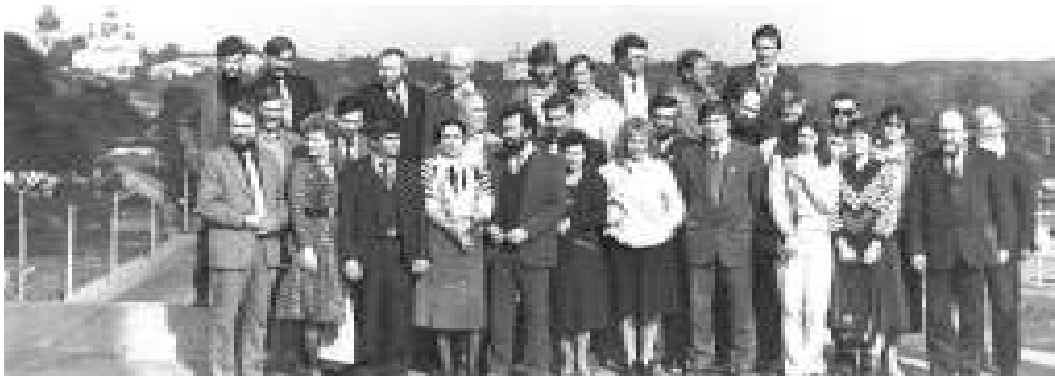
Рис. 4. Учасники третього історико-археологічного семінару “Чернігів та його округа в IX – XIII ст.” (травень 1990 р.). (Фото Л. В. Ясновської).