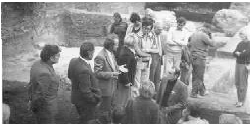
Рис. 2. Учасники виїзного засідання V Міжнародного конгресу славістів під час огляду розкопів на чернігівському дитинці (жовтень 1985 р.). (Фото Л.В. Ясновської).