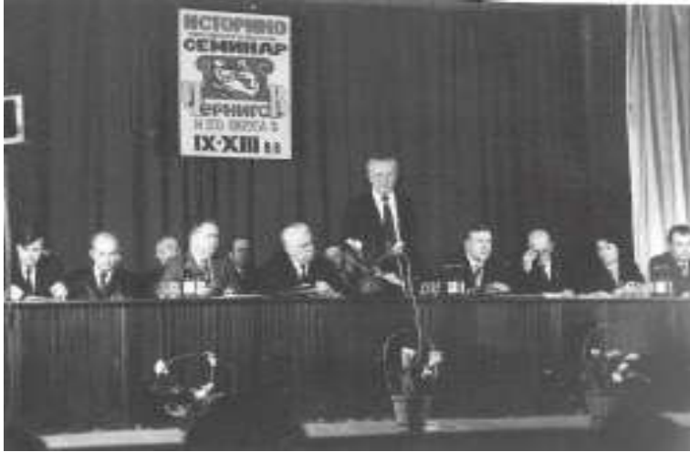
Рис. 3. Пленарне засідання першого історико-археологічного семінару “Чернігів та його округа в IX – XIII ст.” (квітень 1985 р.).

Новые материалы к истории скотоводства и охоты в древнем Чернигове // Проблемы археологии Южной Руси. – К., 1990. – С. 39 – 41.