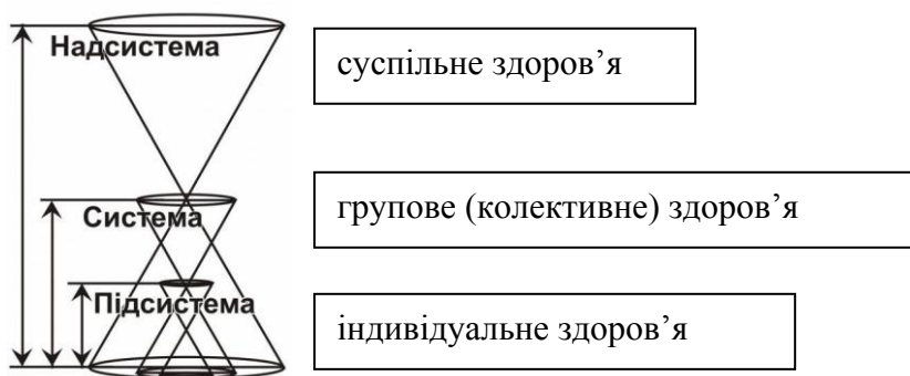
Рис. 1. Індивідуальне здоров'я людини в системі ієрархічних зв'язків

За допомогою причинно-системного аналізу, який розглядає системні відносини з точки зору багатовимірних причинно-наслідкових зв'язків, було виокремлено характеристики, які оцінюють індивідуальне здоров'я людини як підсистему в системах більш високого рівня [13] (групове (колективне) здоров'я, суспільне здоров'я), а також зв'язки між підсистемами (складовими індивідуального здоров'я) (рис. 1).