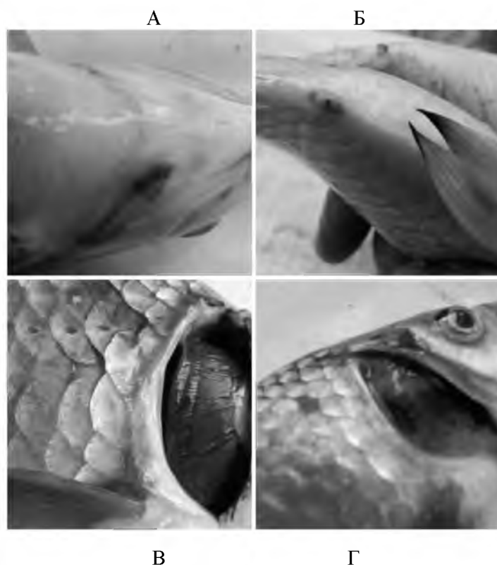
Рис. 2. Стан зовнішніх покривів карася (А – черевна частина тіла, Б – відділ анального отвору) і зябер риб при впливі 0,4 \text{ мг/дм}^3 гліфосату (Г) та контрольної групи (В)

Карась виявився досить стійким, і при 0,04 \text{ мг/дм}^3 гліфосату характерних патологічних уражень зовнішніх або внутрішніх органів у нього зафіксовано не було. Зміни, виявлені у карася срібного при 0,4 \text{ мг/дм}^3 дії гліфосату, представлені на рис. 2-3.