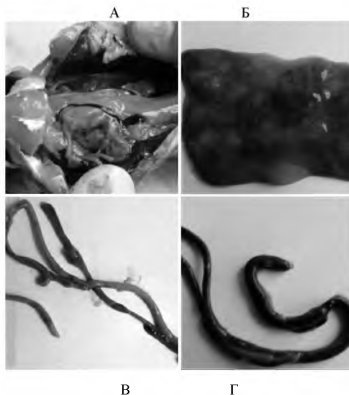
Рис. 3. Стан печінки карася за нормальних умов (А) і при впливі гліфосату (Б), стан кишковика карася за нормальних умов (В) і при впливі гліфосату (Г)

Кишковик, печінка і жовчний міхур карасів, які перебували в умовах дії 0,4 \text{ мг/дм}^3 гліфосату, також містили ознаки ураження: структура печінки повністю порушена, жовчний міхур був нехарактерного червоного забарвлення, а вміст кишковика – зеленуватого кольору (рис. 3). Варто відмітити, що дана концентрація виявилася летальною для 50 % особин протягом 14-добового експерименту, переважно самців.