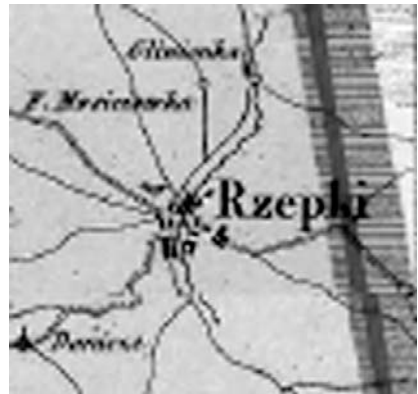
Рис.3. На сучасній супутниковій карті Google (зліва) ще можна побачити, де колись протікала річка Глинянка.

Таким чином, час появи Ріпок (чи, точніше, Ріпок-Пероцька) необхідно скоригувати. Першим з цих двох поселень, безсумнівно, виник Пероцьк (Пероцьке, Піроцьк) – родова маєтність любецьких бояр Пероцьких, однієї із найдавніших родин регіону. На слушну думку О.Лазаревського, роди любецьких шляхтичів Пероцьких, Даничів та Репчичів (різні гілки цього роду виступали під прізвищами Ріпчичів, Репчичьких, Репчичів, Рибчичів. – І.К.) походять від єдиного роду – роду Пероцьких 28 . А на думку Філарета (Гумілевського), родина Глібовичів-Пероцьких взагалі походила від давньоруських чернігівських бояр Глібовичів 29 . Однак ми навряд чи зможемо погодитися з цією тезою, скоріше мова йде про родину, пращуром якої був якийсь Гліб Пероцький.