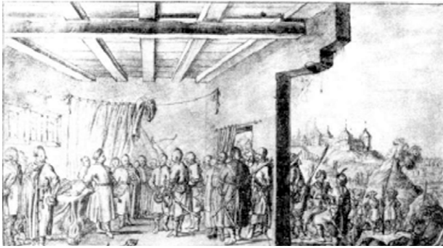
Прийм козацьких послів Я. Радзивілом (гравюра А. ван Вестерфельда) 21 .

Насправді мета Мирського була інша – захопити переправи через Дніпро і Сож і зайти у тил козацькому війську. Після від'їзду козацьких дипломатів основне військо рушило берегом Дніпра вниз до Лоева (у цей час лоевську переправу у ВКЛ символічно називали «Лоевською брамою» князівства), частина піхоти під командуванням Вінцента Гансевського