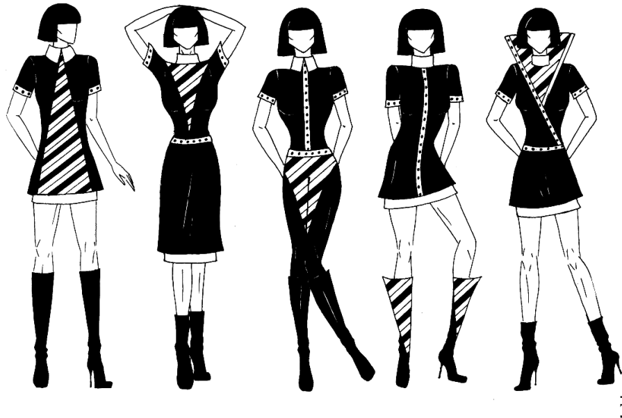
Рис. 2. Стилістичний ряд з урахуванням ритму

Самостійно за допомогою графічних програм студенти також створюють необхідні поверхні та застосовують їх при створенні стилістичних рядів в кольорі.