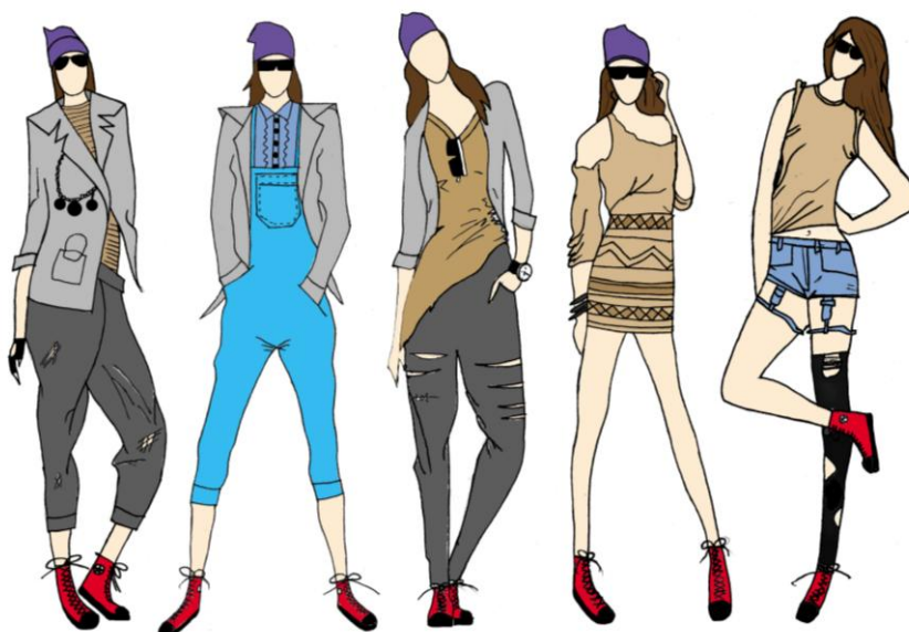
Рис. 4. Міні колекція одягу в стилі гранж

Отримані знання закріплюються на практиці та під час самостійної роботи, виконуючи нові завдання з інтерпретації, стилізації або трансформації першоджерела в декілька прийомів та перетворенню його на одяг, витримуючи певні форми. На основі різноманіття змістовного матеріалу на заняттях з декоративної інтерпретації, трансформації та стилізації першоджерела, при навчанні досягненню художньо-образної, декоративної виразності, гармонійної, цілісної образотворчості форми, набутті навичок творчого застосування прийомів стилізації необхідно дотримуватися основних дидактичних принципів навчання, які полягають в доступності, наочності, послідовності, системності та творчої активності роботи над заданою темою.