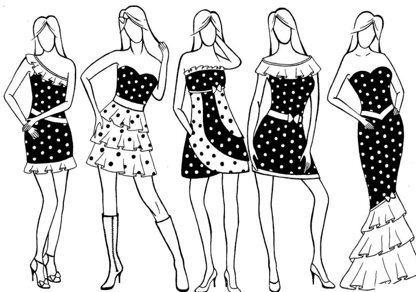
Рис. 3. Стилiстичний ряд романтичного стилю

полягає в досягненні студентами при створенні образів художньо-образної виразності форми предмета при його художньо-композиційному узагальненні на основі глибокого теоретичного аналізу та осмислення форми предмета і його перетворення.