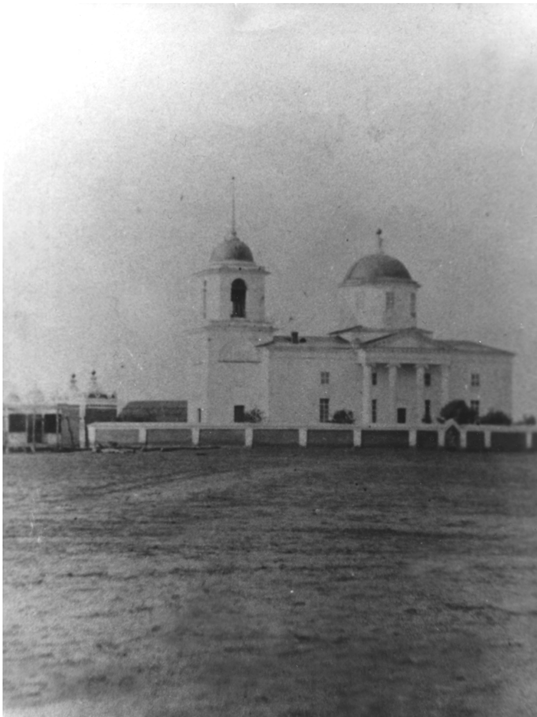
Богоявленська (Замкова) церква у Ніжині (1719–1721), вигляд після перебудування та добудування дзвіниці наприкінці 1820-х – на початку 1930-х років. Фото кінця XIX ст.