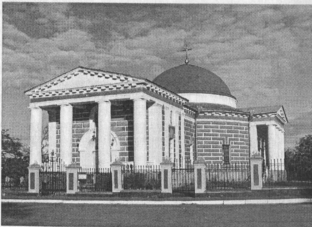
Рисунок 3 – Спасо-Преображенська церква. Любеч

Їхньою ровесницею була мурована Преображенська церква (єдина з усіх храмів Любеча, що збереглася досьогодні), на протилежному боці Базарної