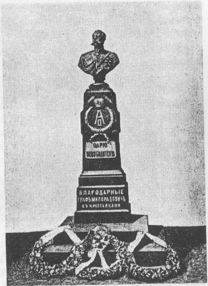
Рисунок 4 – Пам'ятник імператору Олександру II. 1898 р.