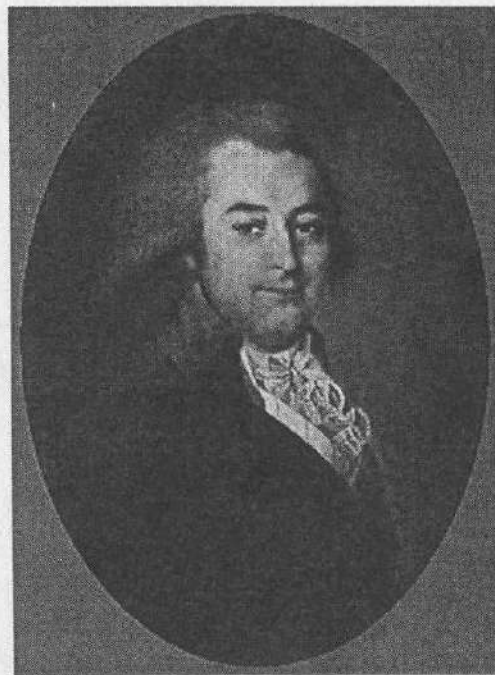
Рисунок 1 – Г.П. Милорадович

Після смерті Г. П. Милорадовича у 1828 р. Любечем володіла його удова О. П. Милорадович (у дівоцтві Кочубей), яка розподілила маєток між на-