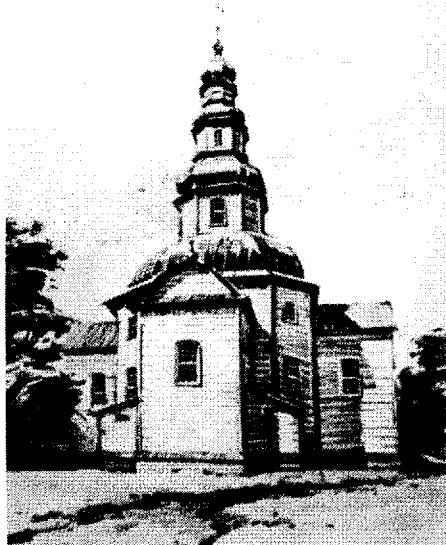
Іл. 1. Церква Покрова Богородиці. Малюнок К. Сидорова. 1930 р.