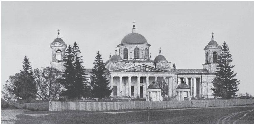
Храм вмц. Екатерины в имени Ляличи Суражского уезда. Фото нач. XX в.

ражского уезда, входившего тогда в состав Черниговской губернии, с большим участком земли и открыт в нем несколько учреждений просветительного и благотворительного характера. Архитектурные и исторические достоинства дворца, открытые в нем учебное заведение и богадельня, по его мнению, выражали бы характерные черты дома Романовых — милосердие и покровительство науке и искусствам. Духовенство приняло проект, решив устроить приют для многочисленных в губернии эпилептиков и слабоумных всех сословий и школу с преподаванием сельского хозяйства для подготовки учителей церковно-приходских школ 1 . Епископ Василий первым пожертвовал на новое дело тысячу руб. 2