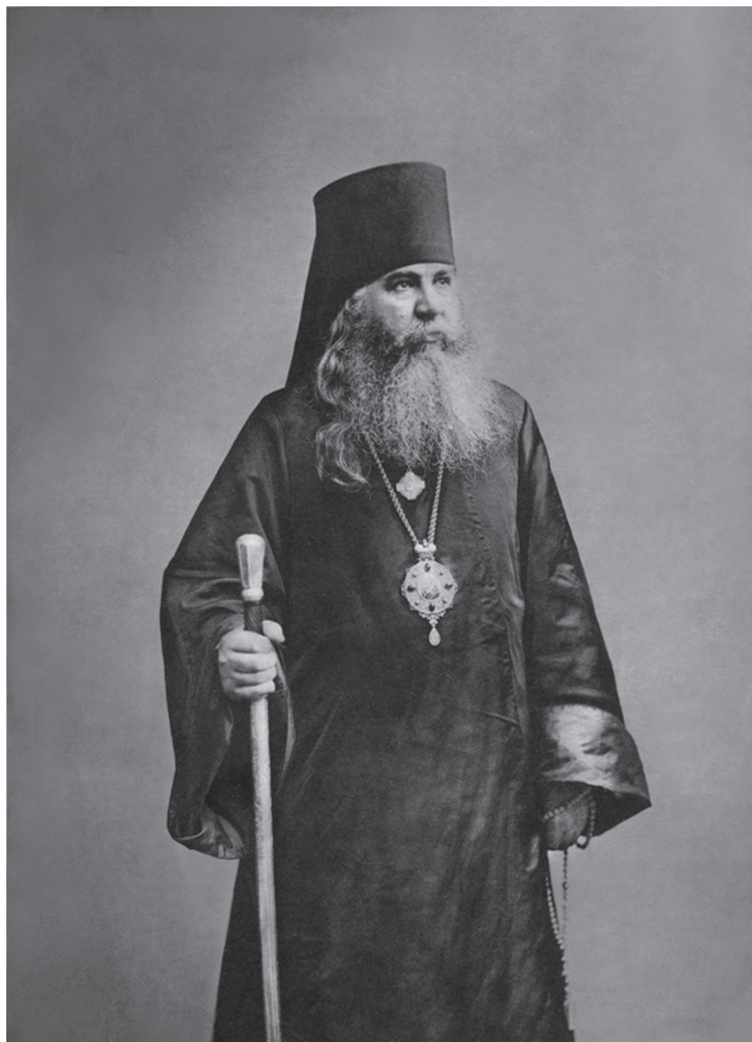
Населій Анкісторъ Сермяковъ и Урмановъ.