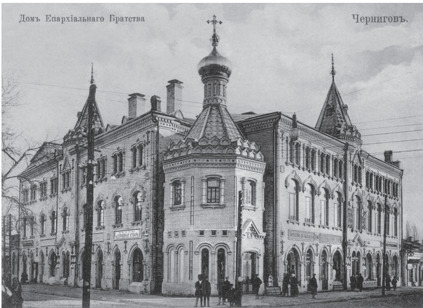
Дом епархиального Братства св. Михаила кн. Черниговского. Фото нач. XX в.

Характерный для владыки образ действий – стремительность. Для описания его деятельности очень подходит слово, часто употребляемое в Евангелии от Марка, – «тотчас». Владыка вступил на Черниговскую кафедру в мае 1911 г., в июне трехэтажный Епархиальный дом был заложен, а уже к 5 сентября, ко времени посещения Чернигова императором Николаем II, дом был построен (без внутренней отделки). 14 ноября следующего, 1912 г. владыка Василий рапортовал в Св. Синод: «Дом этот и храм при нем мною, в сослужении с преосвященным Пахоимом, епископом Новгород-северским, городским духовенством и о. о. депутатами от духовенства епархиального съезда Черниговской епархии, в присутствии г. начальника губернии, всех военных и гражданских чинов, войска, учебных заведений и депутатов от церковных старост епархии, был торжественно освящен» 1 . В честь посещения царской семьей Чернигова в 1911 г. и в честь празднования в 1913 г. 300-летнего юбилея правления династии Романовых Епархиальный дом был назван «Николаевский».