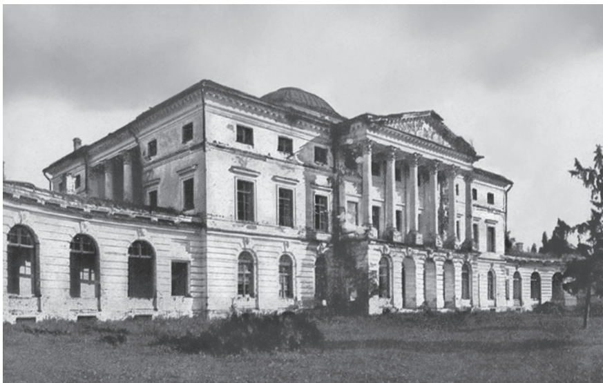
Дворец гр. П.В. Завадовского в с. Ляличи Суражского уезда. Фото нач. XX в.

циалистов 1 . По окончании курсов выдавались свидетельства. Отчеты о курсах представлялись в училищный совет при Св. Синоде и в министерство земледелия. В 1914 г. для нужд Васильевского женского училища в безвозмездное пользование были переданы находящиеся в Кролевецком уезде два казенных рыболовных озера сроком на 12 лет, с тем чтобы епархиальное ведомство приняло на себя обязательство ведения на озерах правильного рыбного хозяйства и разведения ценных пород рыбы 2 .