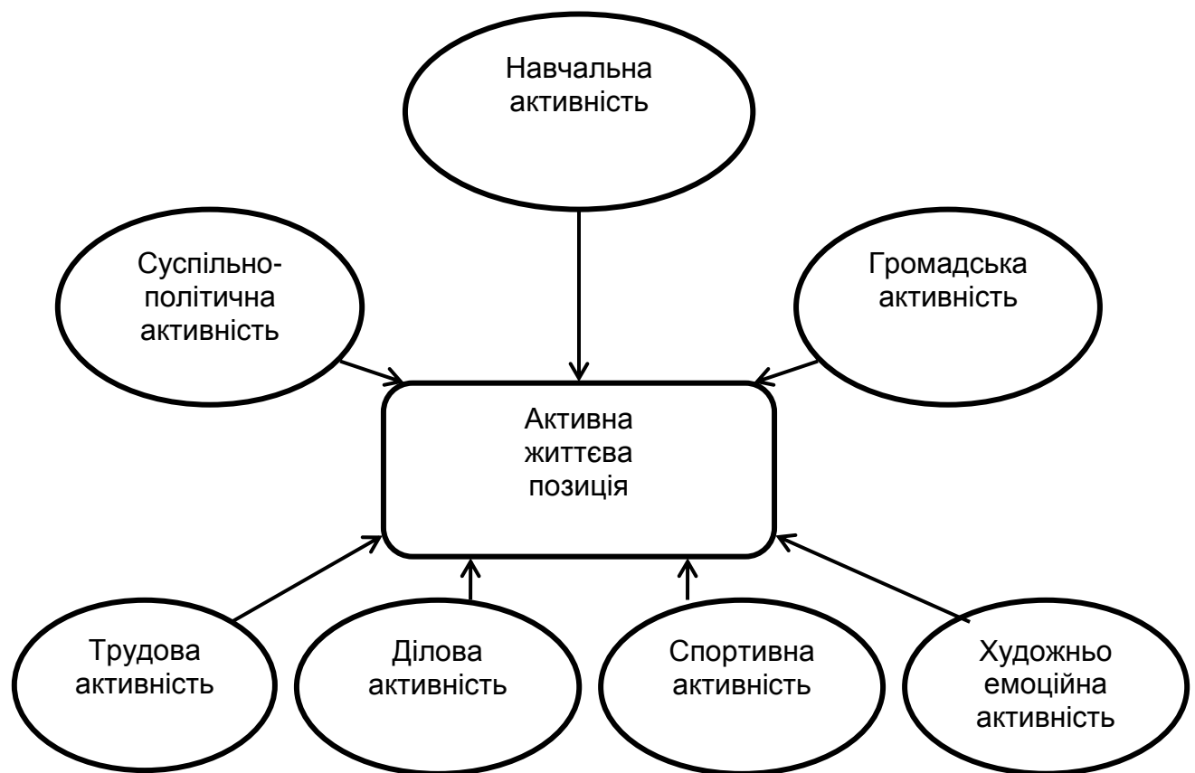
Схема 1. Складові активної життєвої позиції

колективу, самого себе, природи, навчання, праці тощо) і проявляється в діяльності.