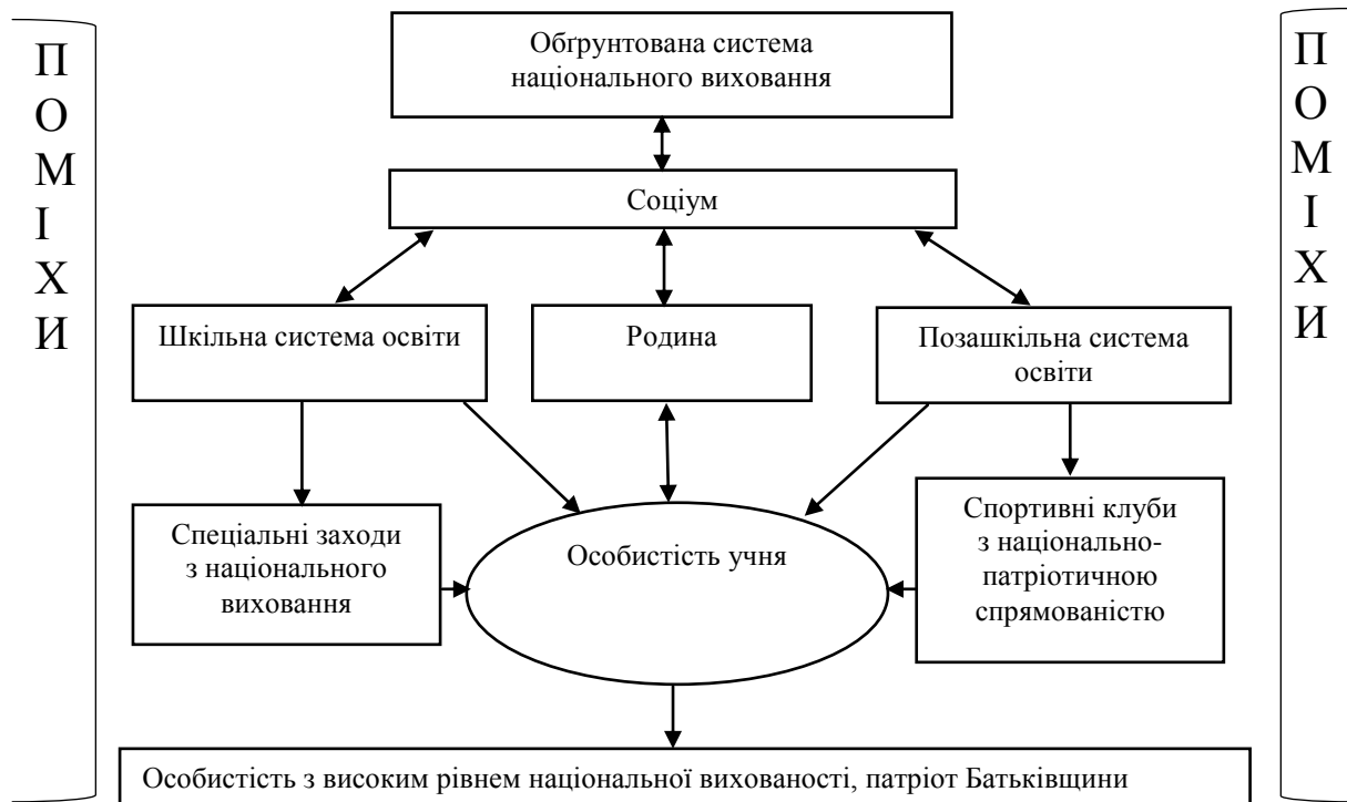
Рис. 1. Система національного виховання школярів

Національне виховання найбільш відповідає потребам відродження України [2; 3; 5]. Виховання у молодого покоління почуття патріотизму, відданості справі зміцнення державності, активної громадянської позиції нині можуть стати актуальними проблемами роботи спортивних клубів, орієнтуючи позаурочну роботу не тільки на досягнення спортивних результатів та зміцнення здоров'я, а і на національне виховання учнівської молоді.