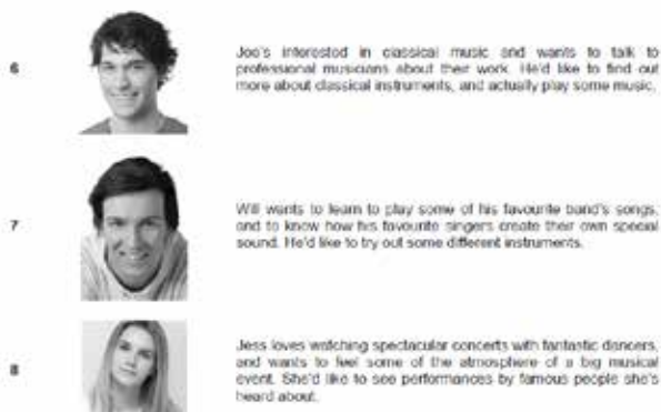
Рис. 2. Фрагмент тесту Preliminary Simple Paper 6 PET (Preliminary English Test) (2015) з розділу Reading and Writing

The people below all enjoy music. On the opposite page there are descriptions of eight places where people can have different musical experiences. Decide which place would be the most suitable for the following people. For questions 6 – 10, mark the correct letter (A – H) on your answer sheet.