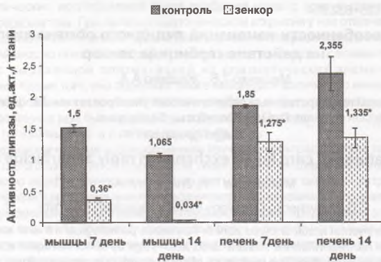
Рис.2. Изменения активности липазы в тканях карпа (0+) под действием зенкора

Доказательством правильности вышеизложенных предположений может служить установление уровня активности липазы. Липаза (К.Ф.3.1.1.3; фермент, катализирующий гидролиз эфиров глицерина) - гликопротеид, состоящий из одной полипептидной цепи с несколькими дисульфидными связями и двумя меркаптогруппами, блокирование которых не влияет на активность фермента. Активный центр содержит серин [2]. Особенность липаз - активность на поверхности раздела фаз, образованных липидом и водой. Считают, что липаза содержит участок, отвечающий за "активацию поверхностью", а сама активация обусловлена фосфорилированием и, как следствие, изменением конформации молекулы фермента [2]. Стимулируется липидный обмен рядом гормонов: адреналином, глюкагоном, кортикостероидами и гипофизарными гормонами. Через аденилатциклазную систему активации адреналин и глюкагон активируют триацилглицеринлипазу, которая является регуляторным ферментом. Инсулин противодействует активации аденилатциклазы этими гормонами, тем самым угнетая липолиз. Нами получены следующие результаты: активность липазы в белых мышцах и печени достоверно уменьшилась уже на 7-й день эксперимента в 4 и 1,5 раза соответственно (рис. 2). На 14-й день изменения оказались еще более глубокими: активность липазы уменьшилась в мышцах в 31 раз, в печени - в 1,7 раза по сравнению с контролем (рис. 2).