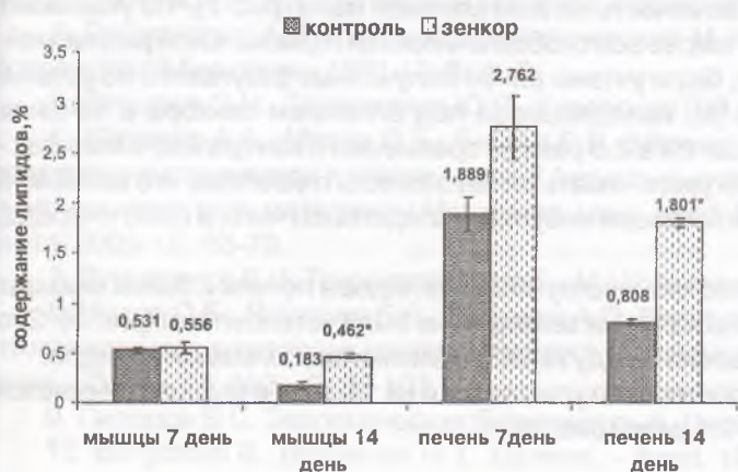
Рис. 1. Изменения содержания общих липидов в тканях карпа (0+) под действием зенкора (* - данные достоверно отличаются от контроля ( P < 0,05 ))

Полученные результаты свидетельствуют о недостоверном увеличении содержания липидов печени и белых мышц карпа (0+) под влиянием зенкора на 7-й день эксперимента (рис. 1). На 14-й день исследования установлено достоверное значительное увеличение количества липидов указанных тканей: в печени - в 2,2 раза по сравнению с контролем, в белых мышцах - в 2,5 раза (рис. 1). Поскольку рыба находилась на эндогенном питании, такие изменения свидетельствуют не только об отсутствии значительного использования липидов в качестве энергетического субстрата, более того, происходит их интенсивный анаболизм и накопление в тканях.