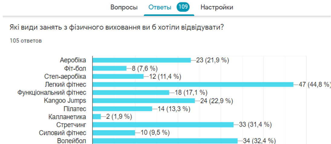
Рис. 1. Фрагмент відповідей студентів на питання анкети «Які види занять з фізичного виховання ви б хотіли відвідувати?»

На початку експерименту було проведено опитування студентів щодо їх побажань стосовно організації освітнього процесу з фізичного виховання. Одним із питань було таке: «Які види занять з фізичного виховання ви б хотіли відвідувати?», на що 44,8% студентів відповіли, що бажали б відвідувати легкий фітнес (soft fitness – м'який фітнес, легкий фітнес) (рис. 1). Ці студенти увійшли до ЕГ.