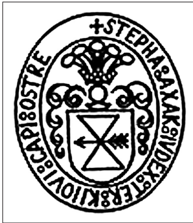
Рис. 4. Печатка Стефана Аксака 1629 р. (за: Однороженко, 2012, с. 151)

За розподілом батьківського спадку Стефану Аксаку (рис. 4) дісталися Святильнів, Бобрик та Рудня, а Михайлу – Гоголів, Димерка, Старі та Нові Рожни (Александрович, 1881, с. 32). У 1630 р. Стефан Аксак став остерським старостою, що дозволило йому й надалі боротися за збільшення володінь (Літвін, 2016, с. 258–259). Матеріали королівської люстрації 1636 р. згадують численні маєтності Аксака на Київщині, у тому числі отримані за дідичним правом (Lustracya, 1877, s. 213). Стефан Аксак також вважається засновником Козельця. Коли у 1663 р. польський король під час лівобережного походу надав місту магдебурзьке право, засновником міста зазначався саме Стефан Аксак, який заклав замок «для разныхъ случаевъ и для защиты противъ наѣздовъ непріятельскихъ» (Описи, 1989, с. 55–56). В описах кінця XVIII ст. згадувались козелецькі укріплення, можливо побудовані саме за старостування Аксака: «городское укрѣпленіе обнесенное, но отъ древности осыпавшееся», або ж: «городъ, обнесенный землянымъ валомъ, но по древности совсѣмъ развалившимся» (Описи, 1989, с. 55, 202–203).