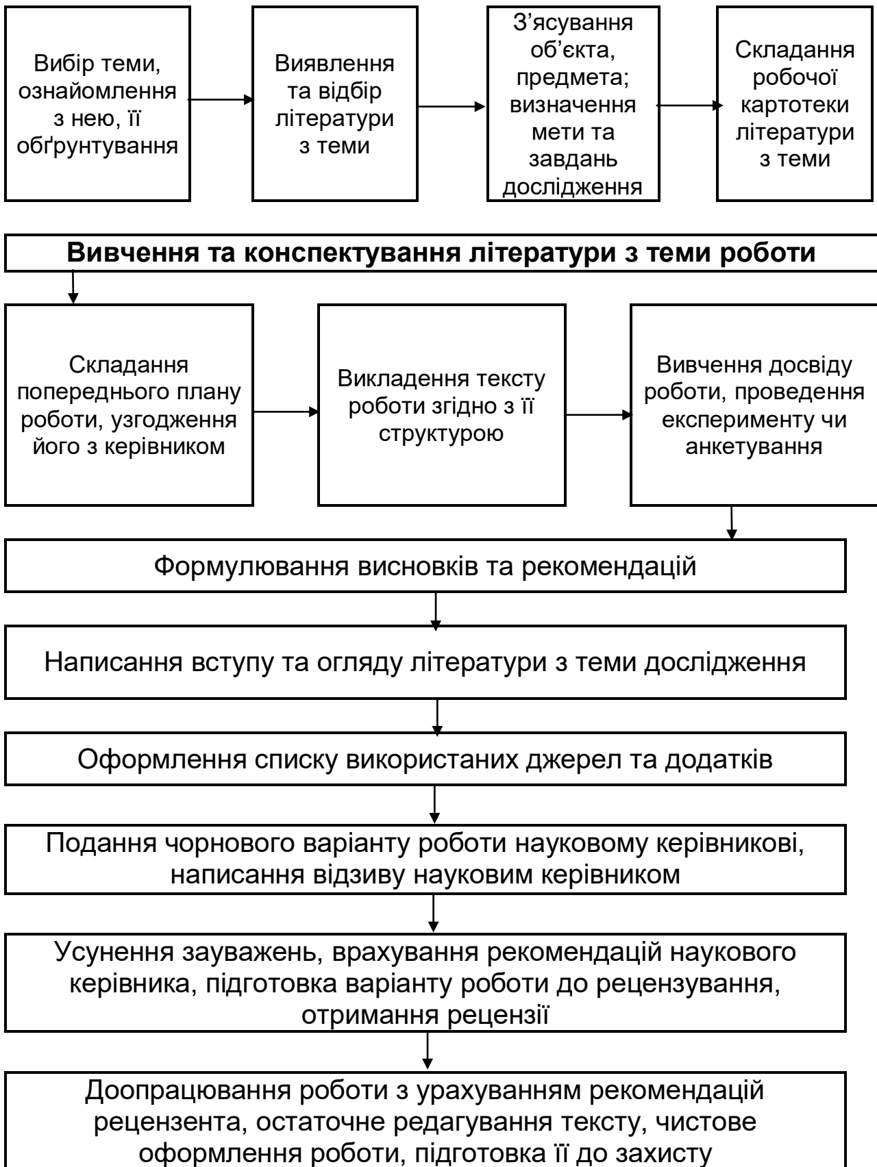
Додаток 3. Алгоритм написання курсової (дипломної) роботи