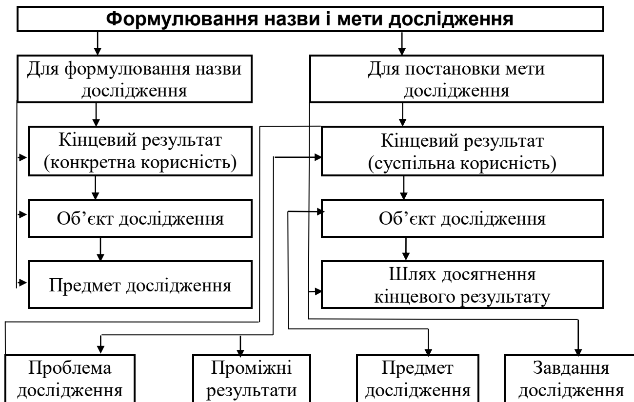
Додаток 2. Схема формулювання назви і мети дослідження