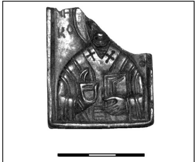
Рис. 1. Пірофілітова іконка Св. Миколая Мирлікійського з поселення Шестовиця-Заплава

До виробів, які зустрічаються рідко у регіоні, відносяться рибальські грузила (Чернігів, Любеч, поселення Рів-2 та Селище). При їх виготовленні