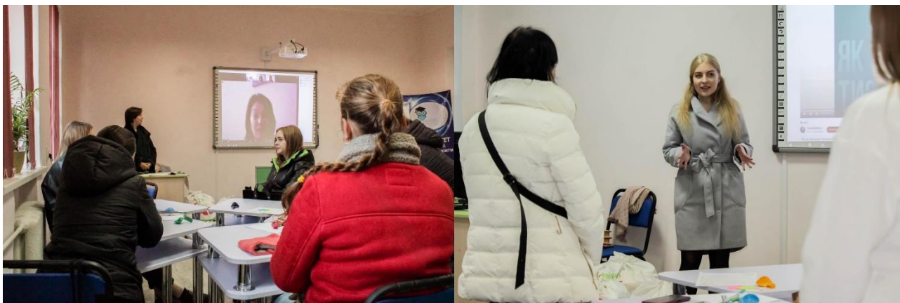
Рис. 1. Тренінг «Почуємо один одного, підтримаємо, допоможемо: розвиток навичок саморегуляції емпатійного спілкування в умовах війни»