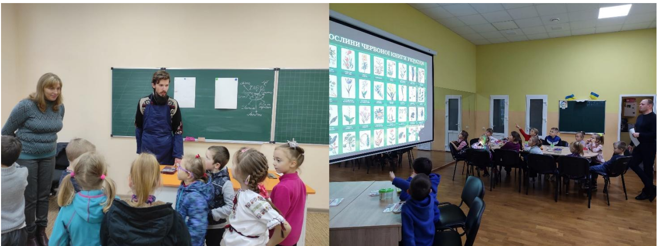
Рис. 5. Психолого-педагогічна підтримка першокласників під час адаптаційного періоду в умовах невизначеності