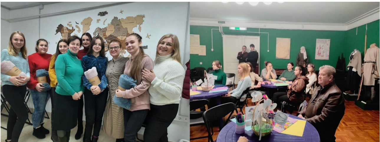
Рис. 2. Англомовні ресурсні писемні практики для майбутніх учителів початкової школи в умовах невизначеного часу