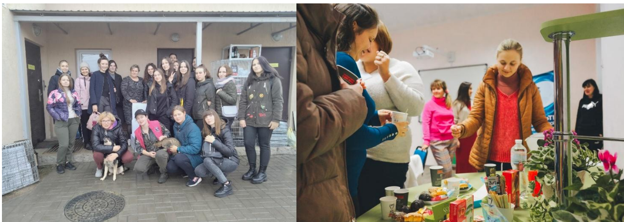
Рис. 3. 3D підтримка здобувачів освіти: Допомога собі, Допомога іншим, Допомога довкільню на демократичних засадах в умовах воєнного часу