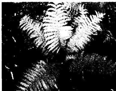
Рис. 3. Страусове перо звичайне ( Matteuccia struthiopteris (L.) Tod.) (окол. с. Мезин)