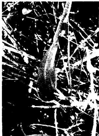
Рис. 1. Вужачка звичайна ( Ophioglossum vulgatum L.) (окол. с. Деснянське)

До складу території Мезинського НПП увійшло 8 природно-заповідних територій, серед них особливий інтерес становить ландшафтний заказник загальнодержавного значення «Рихлівська дача» площею 789 га.