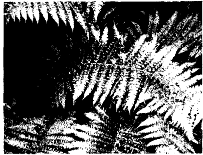
Рис. 6. Багаторядник Брауна ( Polystichum braunii (Spenn.) Fee) (окол. с. Мезин)