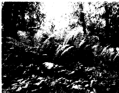
Рис. 4. Популяція Matteuccia struthiopteris в окол. с. Вишеньки