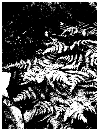
Рис. 2. Голокучник дубовий ( Gymnocarpium dryopteris (L.) Newm.) (окол. с. Радичів)