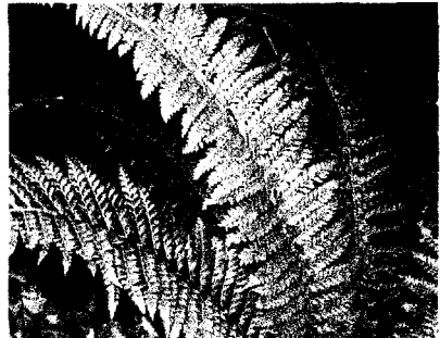
Рис. 8. Багаторядник шипуватий ( Polystichum aculeatum (L.) Roth) (окол. с. Розлети)

Ця територія, як справжні міні-Карпати, поєднує розгалужену яружно-балкову систему Понорницького лесового острова з ділянками листяних лісів з дуба звичайного, липи серцелистої, клена гостролистого, граба звичайного, ясеня звичайного.